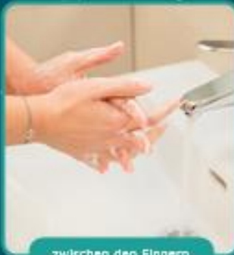
zwischen den Fingern