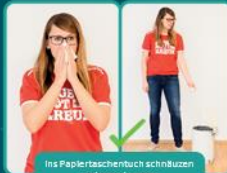
ins Papiertaschentuch schnüzen und entsorgen