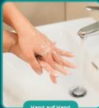
Hand auf Hand