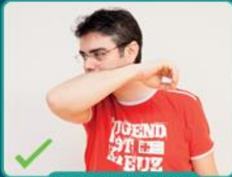
In die Armbeuge husten/niesen