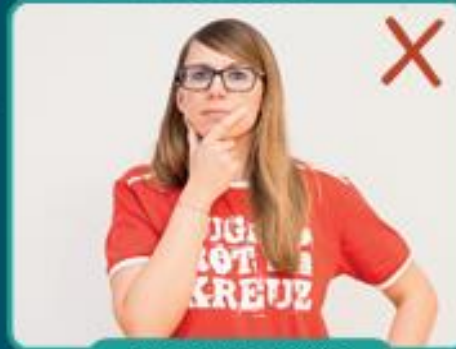
nicht ins Gesicht greifen