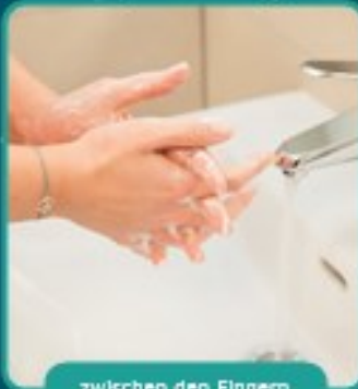
zwischen den Fingern