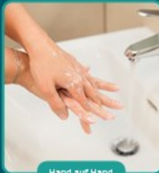
Hand auf Hand